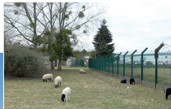
➤ Gestion de friche écopaturage - Les Essarts